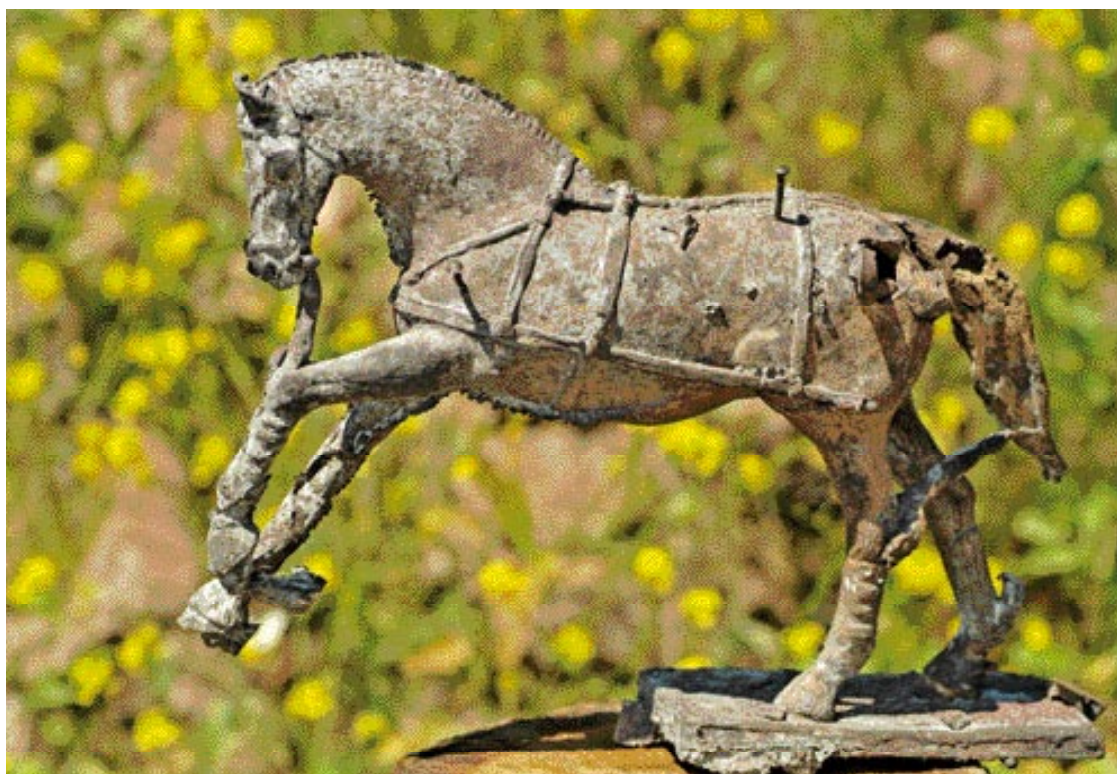
Een beeld zoals het bij de bronsgieter vandaan komt.